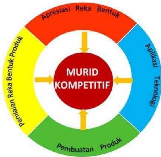
Rajah 2: Domain Reka Bentuk dan Teknologi

KSSM RBT memberi fokus kepada empat domain seperti dalam Rajah 2. Murid akan mengaplikasikan pengetahuan dan kemahiran melalui ktiviti reka bentuk dan penghasilan produk.