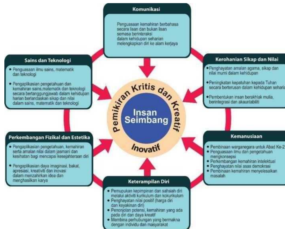
Rajah 1: Kerangka Kurikulum Standard Sekolah Menengah

Kesepaduan ini bertujuan membangunkan modal insan yang menghayati nilai-nilai murni berteraskan keagamaan, berpengetahuan, berketerampilan, berpemikiran kritis dan kreatif serta inovatif sebagaimana yang digambarkan dalam Rajah 1. Kurikulum Pendidikan Seni Visual digubal berdasarkan enam tunjang Kerangka KSSM.