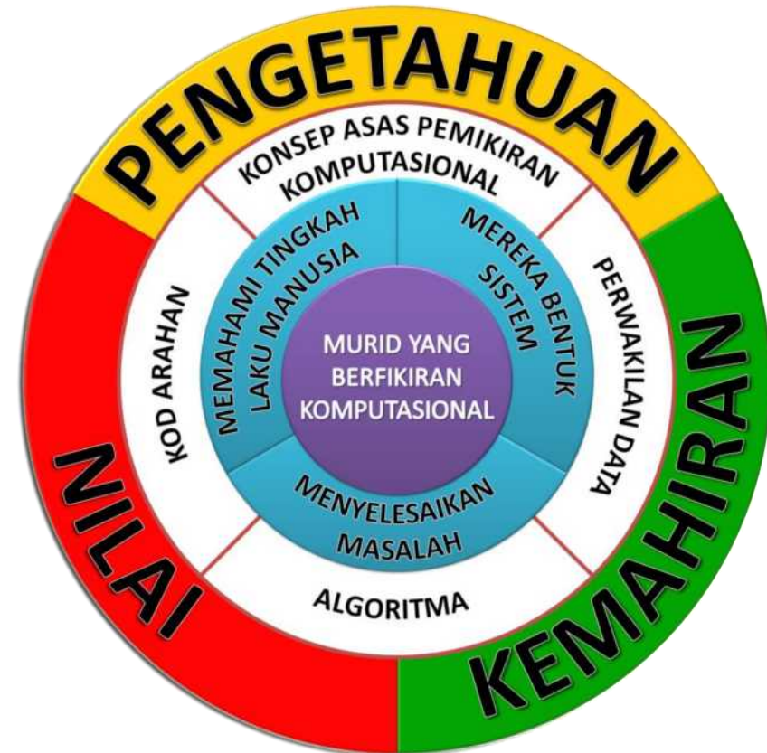
Rajah 2 : Kerangka Konsep Asas Sains Komputer

Pemikiran komputasional ialah kebolehan untuk memahami dan mengaplikasi prinsip asas sains komputer. Melalui pemikiran komputasional, kaedah penyelesaian masalah diterjemah dalam bentuk yang boleh dilaksanakan dengan berkesan menggunakan penyelesaian berteraskan komputer.