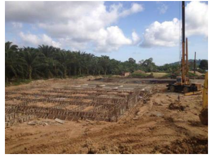
MRSM Semporna diawal pembinaan.