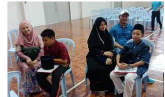
2 Januari 2018 : Pendaftaran pelajar di MRSM Semporna dan merupakan hari pertama beroperasi sebagai institusi pendidikan.

Gambar awal penubuhan dan peristiwa penting