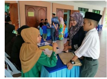
24 Julai 2017 : Pendaftaran pelajar perintis MRSM semporna di Dewan Sri Ixora MRSM Tun Mustapha Tawau