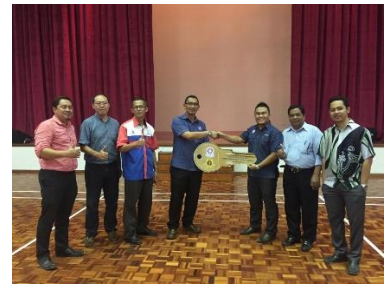
2 Mac 2017 : Majlis Penyerahan Bangunan MRSM Semporna (Fasa 1)