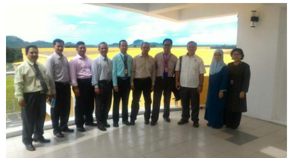
10 Julai 2017 : Mesyuarat Penyelarasn MRSM Semporna dan lawatan Pengarah BPM ke MRSM Semporna