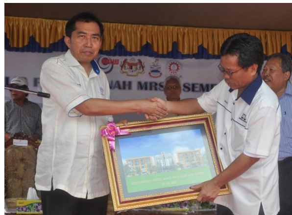
Majlis Pecah Tanah MRSM Semporna dihadiri oleh Menteri Kemajuan Luar Bandar dan Wilayah, Dato'Seri Haji Mohd. Shafie bin Haji Apdal dan Pengarah MARA.