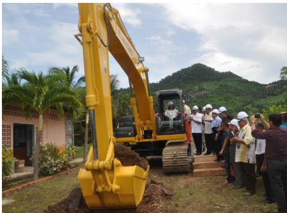
2 Mei 2013 : Majlis pecah tanah MRSM Semporna

Gambar awal penubuhan dan peristiwa penting