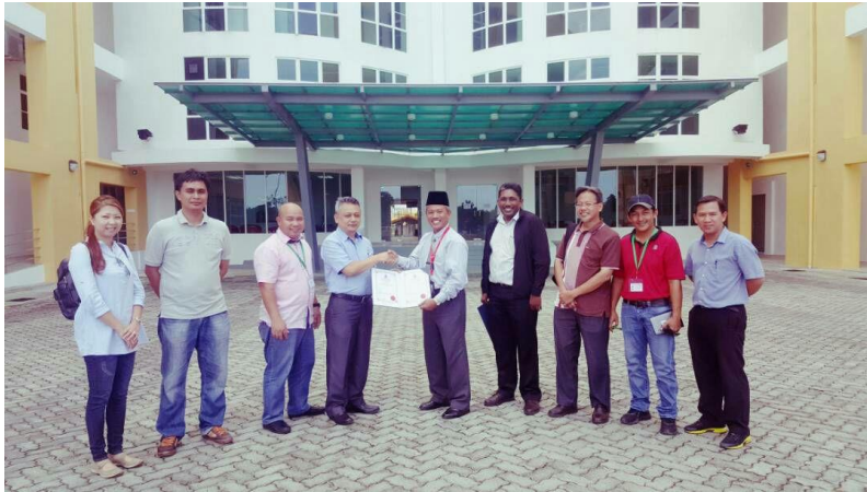
1 Mac 2018 : Penyerahan Sijil Menduduki Bangunan dari Bahagian Binaan dan Seggaraan kepada pengetua