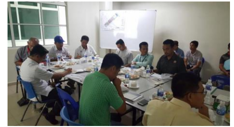
26 Oktober 2016 : Lawatan Pemantauan projek MRSM Semporna oleh PMN Sabah bersama ICU Negeri Sabah.